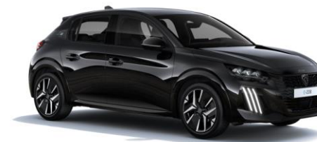
Preto Perla Nera